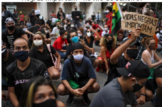
Figura 7: Manifestantes em protesto “Vidas Negras Importam” no Rio de Janeiro.