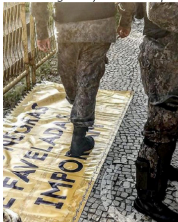
Figura 8: Policiais militares pisam em faixa onde se lê: vidas negras e faveladas importam.

um único compromisso: esmagar a esperança que irrompe em meio às nossas lutas (Figura 8).