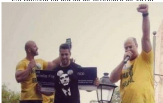
Figura 2: Rodrigo Amorim, deputado estadual mais votado do Rio, com a placa com o nome de Marielle Franco quebrada, e Wilson Witzel, então candidato a governador do Rio pelo PSC em comício no dia 30 de setembro de 2018.

Fonte: Reprodução Jornal O Globo, 8/10/2018.