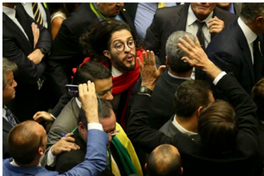
Figura 1: O ex-deputado Jean Wyllys cospe em Jair Bolsonaro.