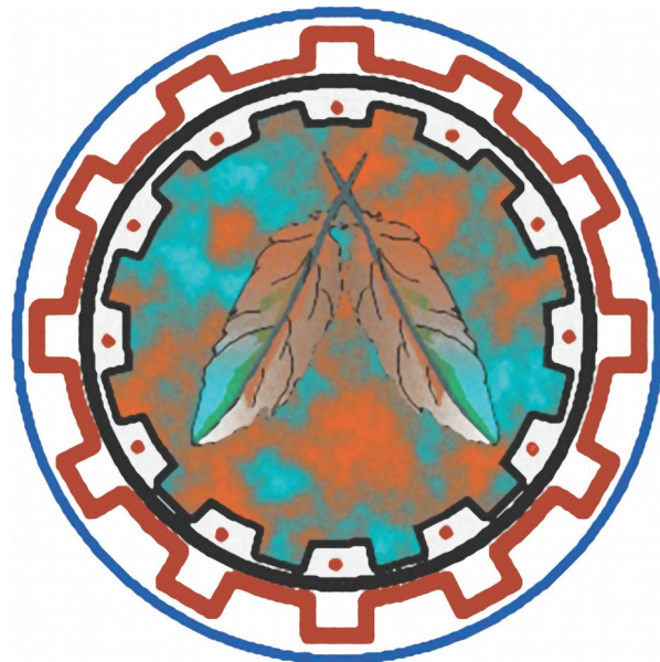
CENTRO DE CULTURA SABUKÁ KARIRI XOCÓ

O grupo Sabuká Kariri-Xocó realiza há mais de 20 anos, por meio da educação patrimonial, uma troca verdadeira e honesta, com toda a sociedade, para que todos conheçam as lutas, a ancestralidade e a verdadeira realidade de resistência e existência do povo Kariri-Xocó. O grupo viaja por todos os cantos para estar junto de todos, lutando contra muitas situações que colocam em risco a união de todos os seres, o amor, a natureza e o cuidado com o planeta terra.