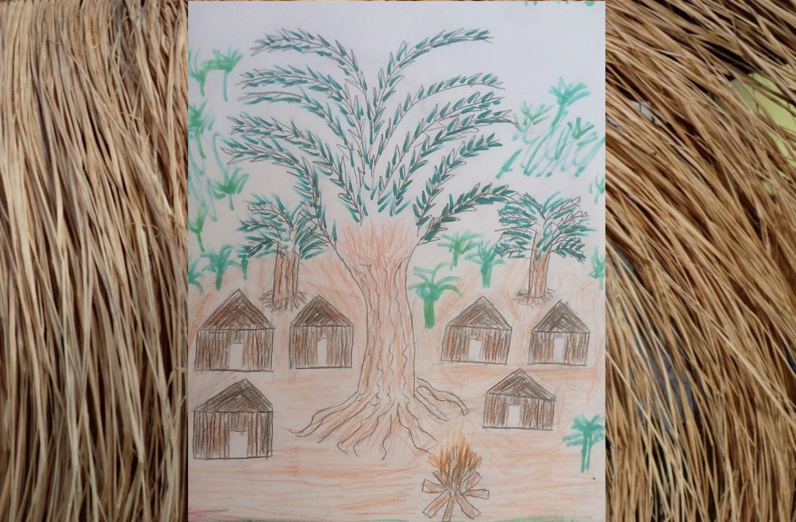
Desenho de Iaru Kariri-Xocó sobre foto de Marli Wunder