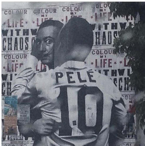
Figura 7 - Arte no muro próximo ao Minhocão e de frente para Praça Franklin Roosevelt em São Paulo.

Memória , quadro do pintor surrealista Salvador Dalí, que aliás aparece como personagem retratada em minhas andanças de outrora. Ambos dizem muito sobre temporalidade e memória.