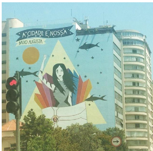
Figura 1 - Arte na lateral de um prédio localizado na Rua da Consolação (SP).

falta desses elementos em minha rotina. Desde adolescente tenho o hábito de andar pelas vias urbanas. A obrigação de percorrer longos caminhos para chegar aos locais de trabalho, de estudo e de lazer foi se transformando, aos poucos, em um movimento prazeroso. Até poucos dias antes do desembarque da Covid-19 em terras brasileiras, eu atravessava de um extremo ao outro quase que diariamente a Pauliceia Desvairada - certamente mais caótica do que a de 1922 de Mário de Andrade - dentro do carro, do ônibus, do vagão do Metrô e a pé (nos trajetos mais curtos).