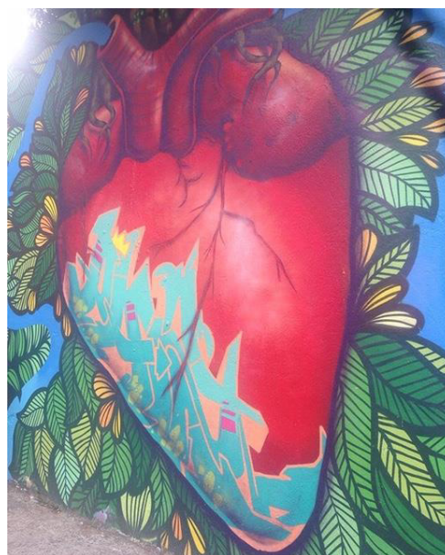
Figura 2 - Arte no muro no Beco do Batman em Pinheiros (SP).

as frases, enfim, o que chamo de flagrantes artísticos urbanos, despertou a minha conectividade com os espaços da cidade. Não sou fotógrafa profissional e não trato as imagens depois de feitas porque me agrada a ideia de deixar registrado aquele momento que a câmera, guiada pelo meu olhar, detectou. Para além da memória localizada no meu cérebro, recorro ao olhar digital como forma de documentação e divulgação.