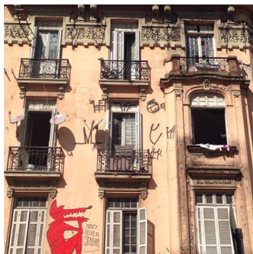
Figura 6 - Arte na parede de um imóvel no Centro de São Paulo.

A mobilidade é atravessada pela tecnologia, se encontra no campo social e torna-se discursiva porque tem ligação com a sociabilidade, materialidade do sentido do espaço urbano.