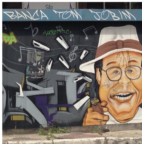
Figura 8 - Arte em banca de jornal no Centro de São Paulo.

Ainda afetada por essa limitação momentânea de mobilidade, exponho aqui minha subjetividade ao compartilhar, no decorrer do texto, meus flagrantes artísticos urbanos antes da pandemia. Atualmente, essas são minhas recentes memórias digitais de São Paulo, uma cidade clicável. Dezembro de 2020.