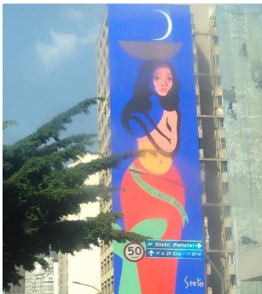
Figura 5 - Arte na lateral do prédio localizado na Rua da Consolação (SP).