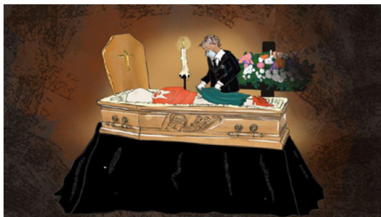
Figura 2 - Ilustração de ritual funeral na Itália durante a pandemia de covid-19, por Jilla Dastmalchi, 2020.

se aproxime” 18 . Lamenta ainda que eles não possam ser cremados em suas melhores roupas e conta que colocam as roupas que a famílias lhe dão sobre o cadáver, como se estivessem vestidos.