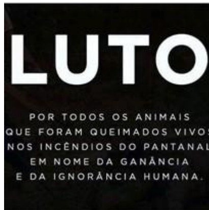
Figura 6 - Luto. Por todos os animais queimados nos incêndios do Pantanal.

Mas são muitas outras as extensões incluídas na Rede, como cursos, encontros, apoio na situação de luto por psicólogos e tanatólogos, lançamento de livros sobre luto, críticas às políticas do governo em relação ao controle da covid-19, artigos, depoimentos de perdas, rodas de conversas sobre morte e luto. Por exemplo, um dos Simpósios de três dias tratou do tema “Morte e Morrer”, com três subtemas, um, “Saudades, Laços e Lutos”, outro, “Luto velado: quando a sociedade não autoriza o indivíduo a sofrer, perdas perinatal e perdas por pets” e o terceiro, “O cuidar até o último instante: o luto antecipatório em cuidados”. Como observei em um dos três temas, e em algumas notícias, houve um alargamento da noção de luto estendido aos animais e, inclusive, biomas. Por exemplo: