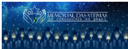
Figura 4 - Imagem da página no Facebook do Memorial das Vítimas do Coronavírus no Brasil.

famílias de vítimas no país, em sua homenagem”, foi vinculado a ela.