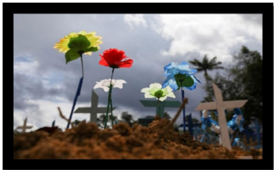
Figura 7 - Sepulturas do cemitério Parque Tarumã em junho de 2020, Manaus.