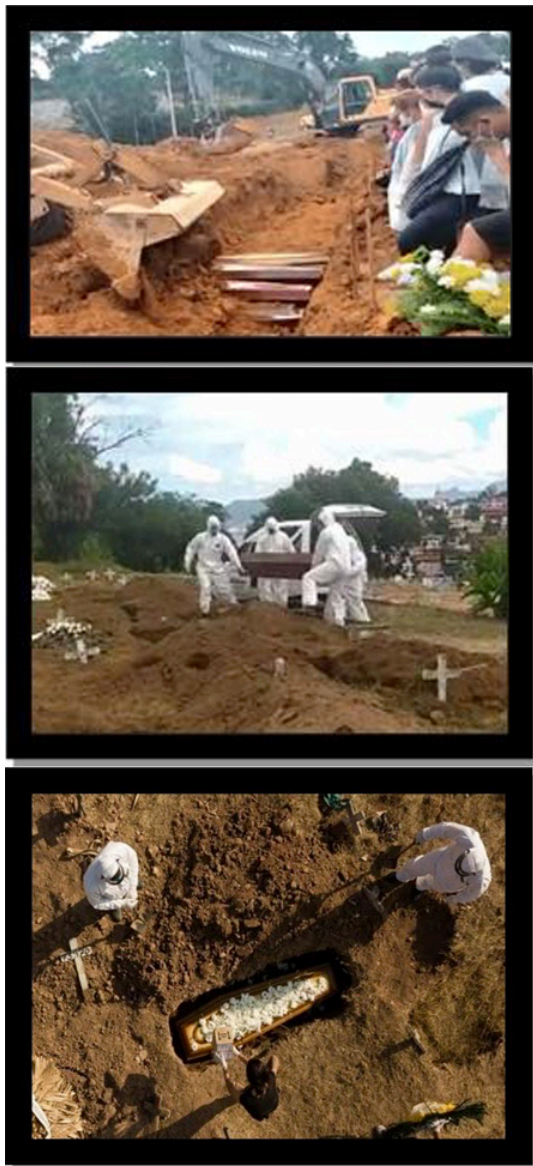
Figura 3 - Sepultamentos de mortos por covid-19 em Manaus, Brasil.