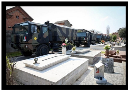
Figura 1 - Exército italiano transporta os corpos dos mortos por covid-19 no cemitério de Ferrara, em Bérgamo, Itália.

abaixo, vemos os caminhões no cemitério de Ferrara.