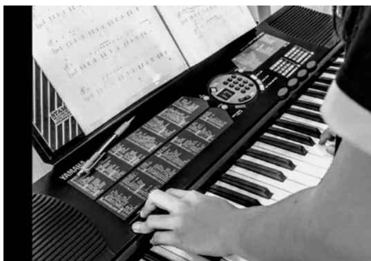
Figura 03 - Fotografia de uma estudante.

Enquanto umas e uns jogavam xadrez, dama e moinho, as quatro instrumentistas ensaiavam sua música. Colegas iam e vinham, contemplando, observando, compartilhando aquele momento de vida. “Se há música tudo fica diferente. [...] A música desperta sentimentos, mesmo que seja resultado de um obstinado trabalho corporal” (ZORDAN, 2017, p. 20). O barulho que vinha de vozes, risadas, gritinhos, instrumentos, peças de dama e xadrez era a encarnação do aumento da potência de agir e pensar de nossos corpos (SPINOZA, 2017). Para isso, tivemos que deixar de lado “[...] a minúcia dos regulamentos, o olhar esmiuçante das inspeções, o controle das mínimas parcelas da vida e do corpo [...]” (FOUCAULT, 2011, p. 136).